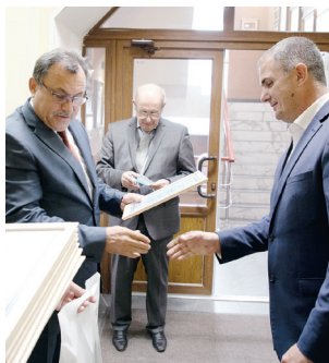
Торжественная церемония открытия и по традиции - вручение благодарственных писем

учёных 20-21 веков, оставивших значимый след в развитии научной мысли. Их достижения в области медицины, физики явились серьёзными прорывами в истории человеческой цивилизации. В далёком 1904 году одним из первых лауреатов премии стал русский физиолог Иван Павлов -